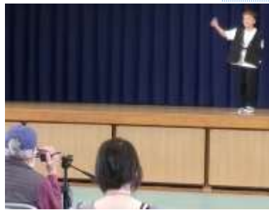
魅了した軽快なステップ