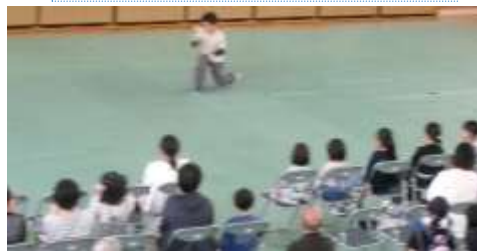
けん玉の大技を見事成功