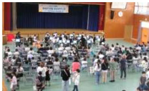
節目を祝い、絆を深める演奏

A-1グランプリでは、『ひろき』による「けん玉」、『はると』による「手品」、『ぽかぽかーズ』による「一輪車披露」、『オールデイ』による「ダンス」、さらに『青垣小OG』による「スペシャルステージ」で、会場に何度も大きな拍手が起きました。これからの青垣を作り、担っていく「地域の太陽 あおがきっ子」が、温かいまなざしで見守られる中、特技を披露し、個性が輝かせました。