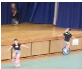
駆け巡った一輪車