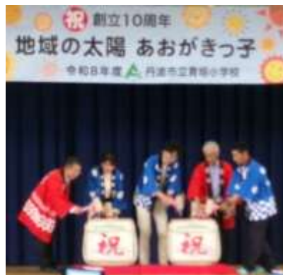
節目を祝う鏡開き