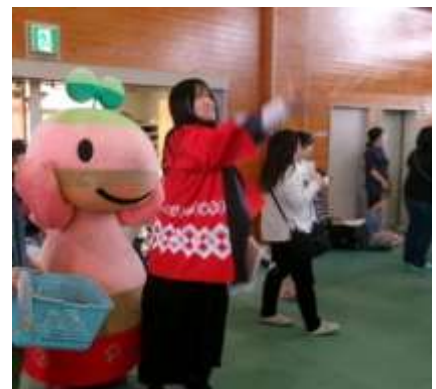
餅まき・駄菓子まき