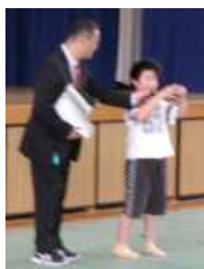
会場を沸かせた手品