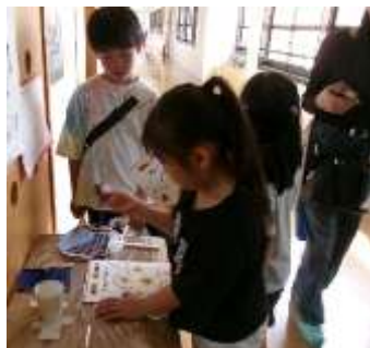
揃うと「あ・り・が・と・う」

また、校舎を巡るスタンプラリーも行われました。「絵の具や彫刻刀を使って作品を作ったね」などのヒントをもとに、図工室など5箇所を探し当てました。スタンプを全部揃えると「あ・り・が・と・う」の言葉になり、青小限定シールをゲットすることができました。