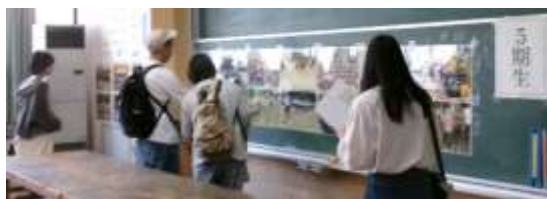
思い出話に花を咲かせて

校舎北館では、特別教室を「集いの場」として、卒業年度別の写真展示がありました。同窓生や保護者が、写真を話題に歓談する様子がとても微笑ましかったです。