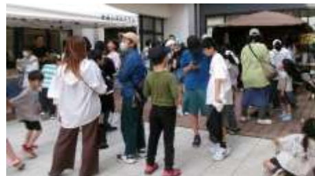
並んでいる間も会話が弾む

また、校舎を巡るスタンプラリーも行われました。「絵の具や彫刻刀を使って作品を作ったね」などのヒントをもとに、図工室など5箇所を探し当てました。スタンプを全部揃えると「あ・り・が・と・う」の言葉になり、青小限定シールをゲットすることができました。