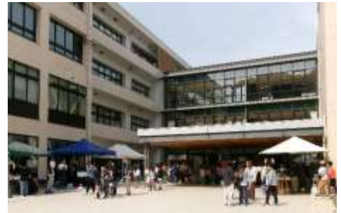
卒業生、在校生、保護者、地域の方々が青垣小学校に集う