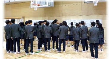
令和6年度のスタートにあたって

保護者の皆様、地域の皆様におかれましては、本年度も引き続き、本校の教育活動に対するご理解・ご協力をよろしくお願いいたします。