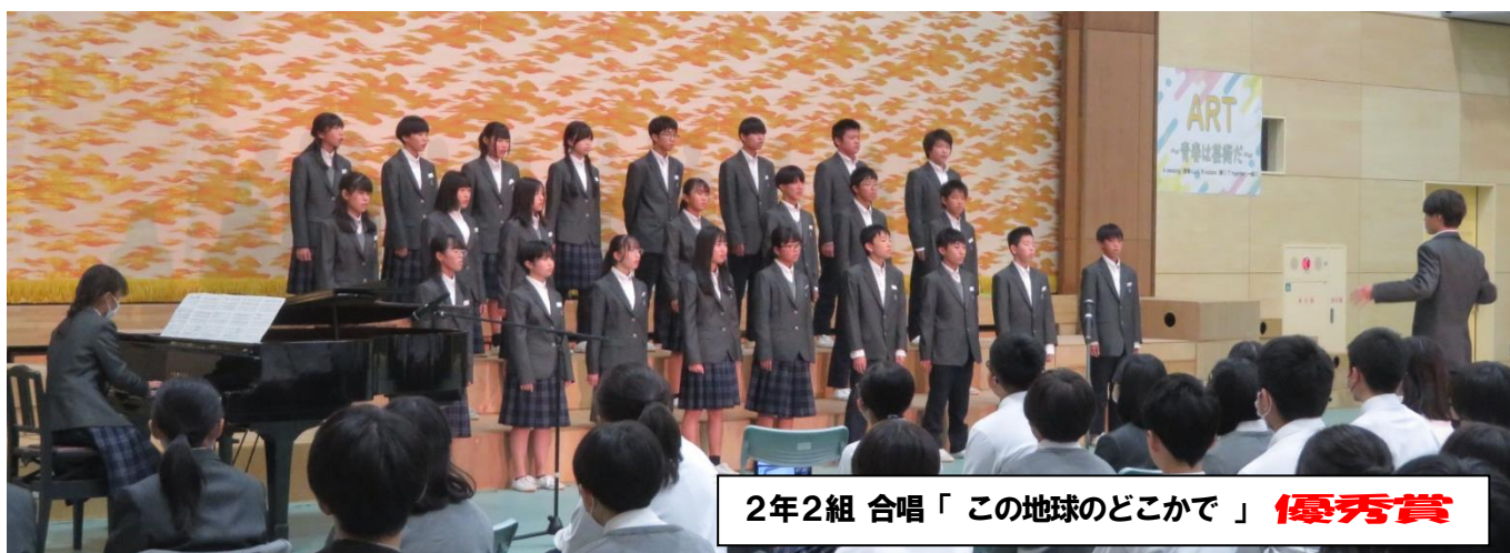
2年2組 合唱「この地球のどこかで」 優秀賞