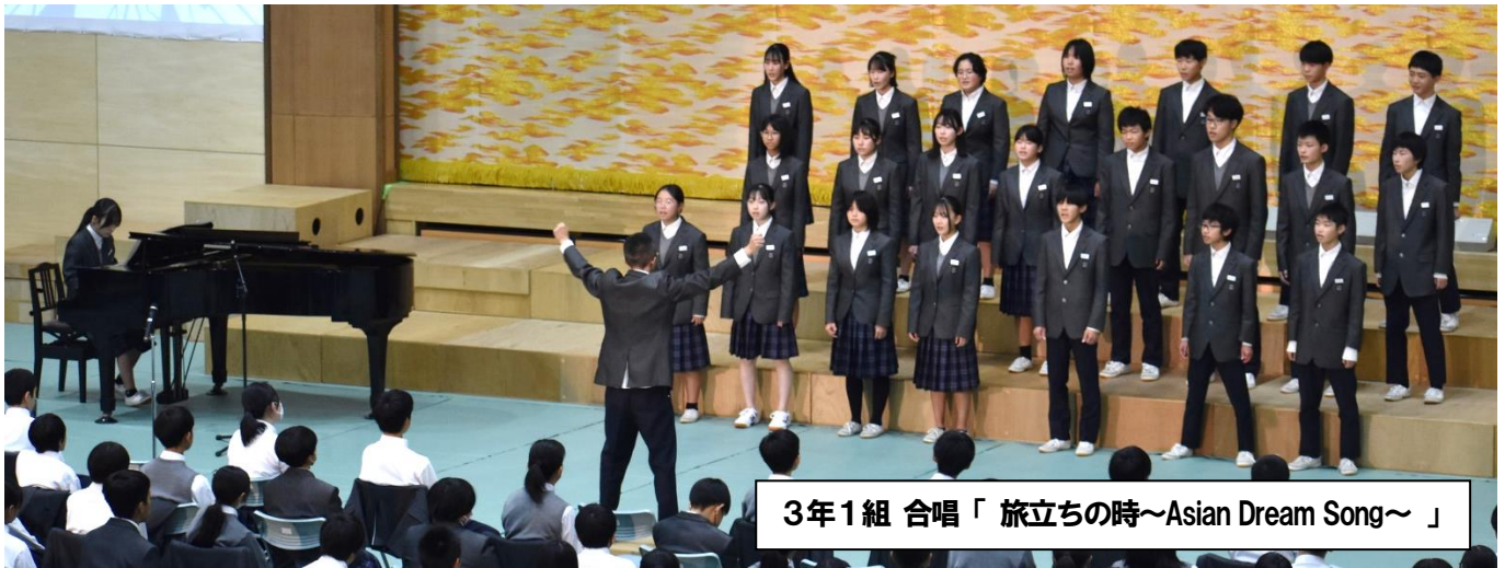
3年1組 合唱「旅立ちの時～Asian Dream Song～」