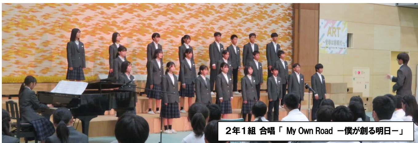
2年1組 合唱「My Own Road 一僕が創る明日ー」