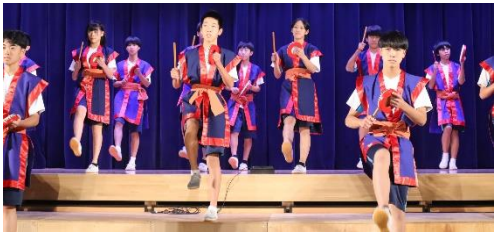
3年1組 演劇「Alice～世界がアリスの夢だったら～」 最優秀賞