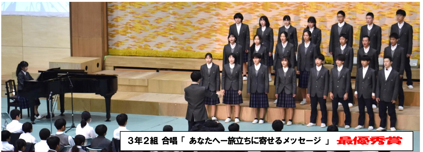
3年2組 合唱「あなたへ旅立ちに寄せるメッセージ」 最優秀賞