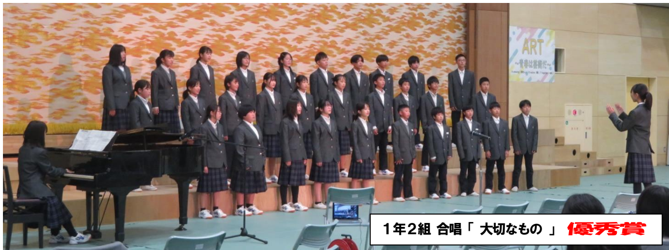
1年2組 合唱「大切なもの」 優秀賞