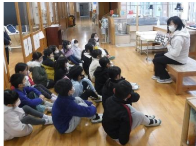
わくわくどきどきにつこり笑顔

月曜日の朝に、とても素敵な時間を作っていたら、前山っ子は、心をほっこりあたたかくして新しい1週間をスタートしています。