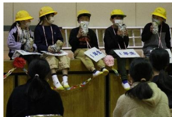
【1年生】『焼き芋祭り』 「あつあつでおいしいな」

6年生からも、お礼にスリーヒントクイズを出しました。「この6年生はだれでしょう」というクイズですが、ちょっとヒントを出すだけで、たくさんの手が挙がって、「〇〇さんです。」と正解する姿には、前山っ子みんなのすばらしいつながりが表れていました。