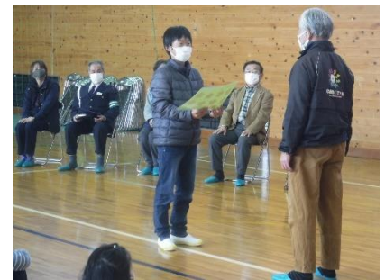
余田会長、いつもワクワクさせていただきありがとうございます。