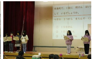
【2年生】市島地域で1日 に配達される郵便は？