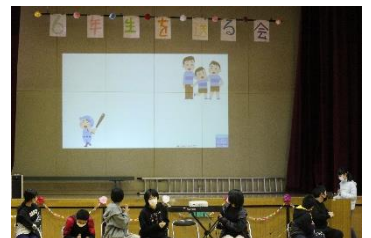
【6年生】3人きょうだい、 野球… この人は？