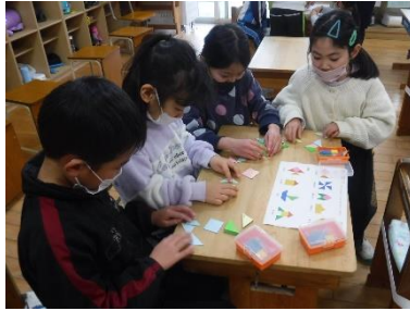
どんな形ができるかな？

2月24日(金)に、来年度前山小学校に入学する新1年生4人が体験入学をしました。この日を心待ちにして歓迎の準備をしてきた現1年生が、まずは学校を案内しました。続いて新1年生は、国語体験で自分の名前をひらがなで書いたり、算数体験で色板を使った形づくりをしたりしたのですが、ここでも現1年生が、やさしくていねいにアドバイスしていました。