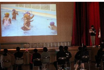
【5年生】6年間のすてき な思い出をふりかえる