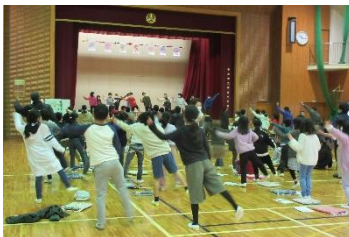
【3年生】『ジャンボリー ミッキー!』で全校ダンス