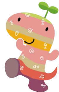
SNSトラブルから自分自身を守る学習を行いました (7/8)