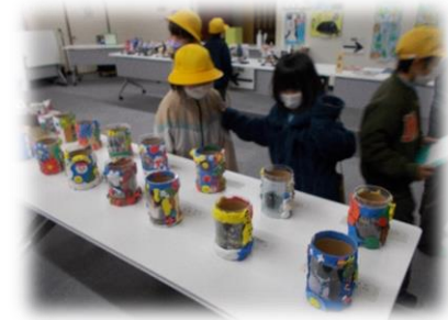
前山っ子も楽しく鑑賞