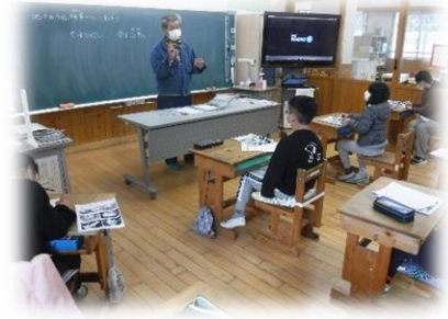
毎年節分に行われる伝統行事