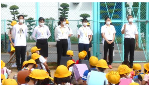
下校の時に全校に紹介しました

9月13日(月)から教育実習が始まりました。今年 は中央小学校の卒業生が5名、実習に来ています。1、 2、5年生のクラスを中心に実習を行いますが、全学 年の授業を参観したり、運動会の時期でもありますの で、練習にも一緒に関わったりもします。子どもたち も大きいお兄さん、お姉さんが来て くれて喜んでい ます。将来、本当の 先生になって帰っ てきてくれること を期待しています。