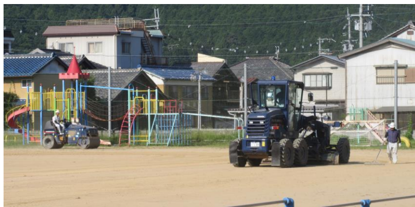
重機を使って整地していただきました

夏休みに予定しておりました、運動場の整地作業ですが、天気の関係で8月28日(土)になりました。池田建設様のご厚意で整地していただきました。コースロープのところ盛り上がり、でこぼこしたり、雨水がたまりやすくなっていたりした運動場がまたたくまに平らで綺麗な運動場に代わりました。