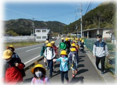
異学年ペアでさあ出発！ 天候にも恵まれました！

クラス遊びをしておいしくお弁当を食べた後は、6年生が企画した全校遊びをし、笑顔いっぱいの交流ができました。