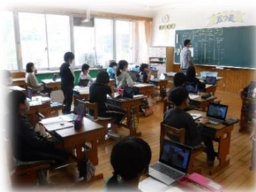
一人一台タブレットPCを活用

また、学級懇談会では、担任から保護者の方にクラスの目標や宿題の取り組み方などの説明をしたり、保護者の方から家庭での生活や学習の様子をお聞きして情報交換をしたりと、学校と家庭の連携を図るための貴重な機会となりました。