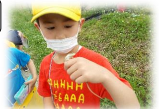
アマガエル？ それとも、 シュレーゲルアオガエル？

命が活発に活動する季節のなかで、休み時間になると貸し出し用のデジタルカメラを構えて校庭の生きものを撮影する前山っ子の姿がたくさんあります。日本に昔から生息しているタンポポと外国から伝来しているタンポポを見分けたり、トノサマガエルとダルマガエルの違いを調べたりして、自然界の命のつながりを学んでいます。