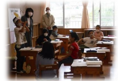
登場人物になりきって