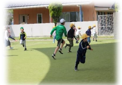
全校遊び…ハンターが来た！ この後先生ハンターも放出！