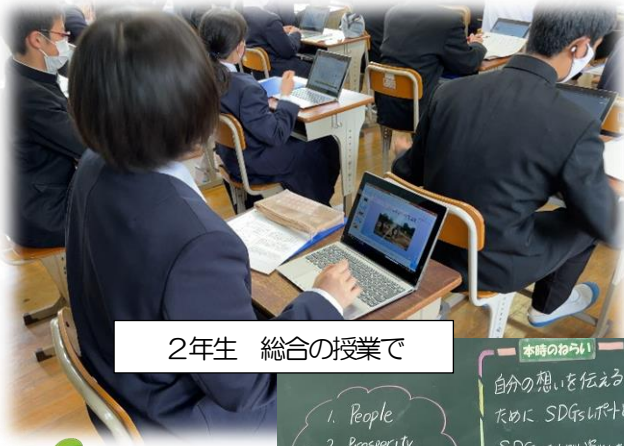
2年生 総合の授業で