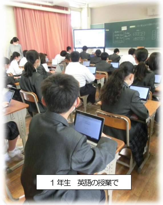
1年生 英語の授業で