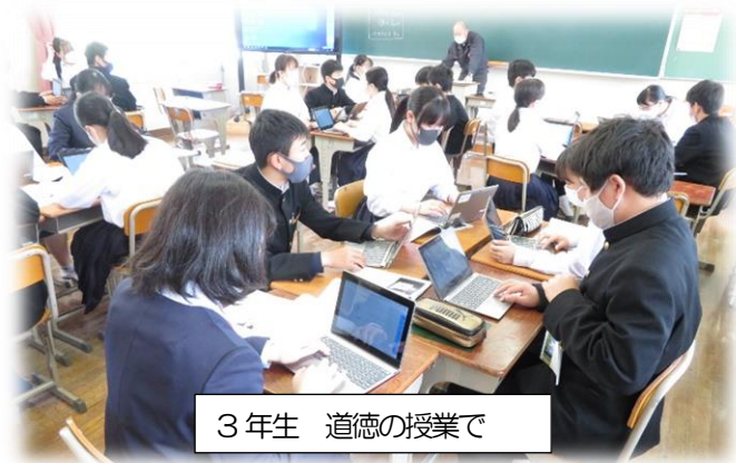
3年生 道徳の授業で

5月26日(水)には、臨時休業になった場合等を想定し、午後から生徒がタブレットを自宅へ持ち帰って、学校と自宅をオンラインでつないで学習を行う予定にしております。保護者の皆様、地域の皆様のご理解をよろしくお願いいたします。