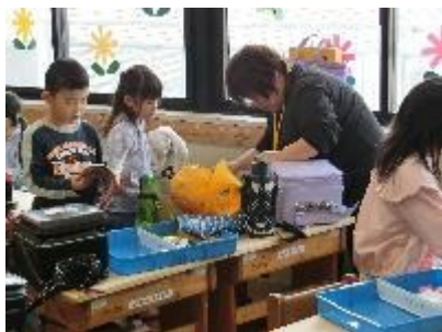
【1年生：東っ子サポート】

4月の間、東っ子サポートスタッフの皆さんが1年生の入学後のサポートをしてくださいました。朝の登校時の見守りをはじめ、教室に入ってからランドセルの片付け、朝の準備等、初めての1年生にとってはとても時間のかかる活動をととてもやさしく支援していただきました。子どもたちも安心して学校生活をスタートさせることができ、新しいことをどんどん吸収しながら成長しています。サポーターの皆様、本当にありがとうございました！