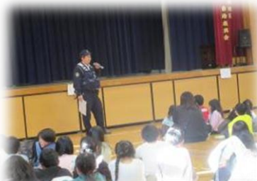
警察の方から、直接 ご指導いただきました。

学校でも繰り返し指導していきますが、ご家庭や地域におかれましても、引き続き、通学路での声かけや、交通ルール・マナーの再確認にご協力をお願いします。子どもたちが安心安全に登下校できる環境を、学校・家庭・地域で一緒になって守っていきたいと思います。