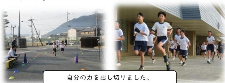
自分の力を出し切りました。

今後も、ご家庭や地域から温かいまなざしで、子どもたちの成長を見守っていただけますよう、お願い申し上げます。