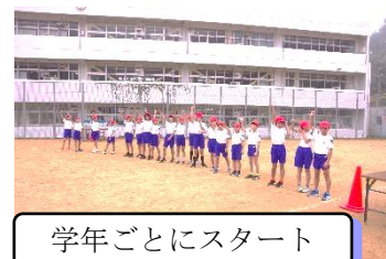
学年ごとにスタート

また、子ども達の安全確保のために、ご協力いただきましたPTA役員・地域の皆様、心より感謝申し上げます。