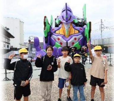
太秦映画村には 原寸大のEVA初号機がありました。