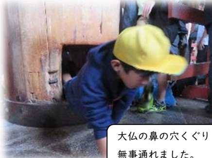
大仏の鼻の穴くぐり無事通れました。