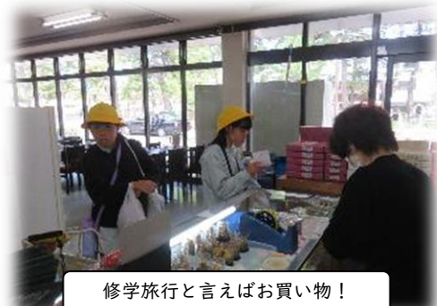
修学旅行と言えばお買い物!