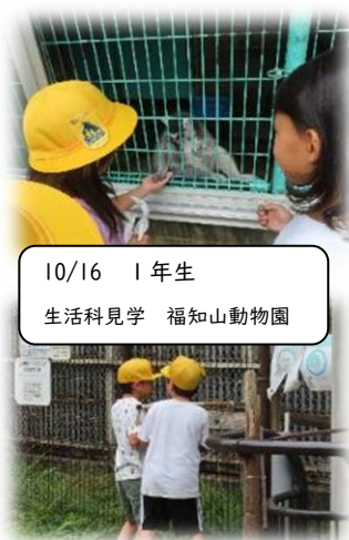
10/16 1年生 生活科見学 福知山動物園