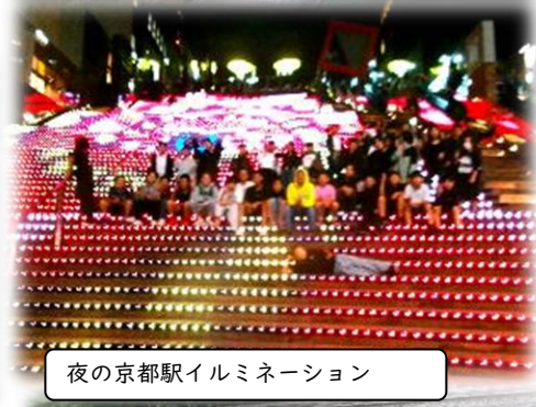
夜の京都駅イルミネーション