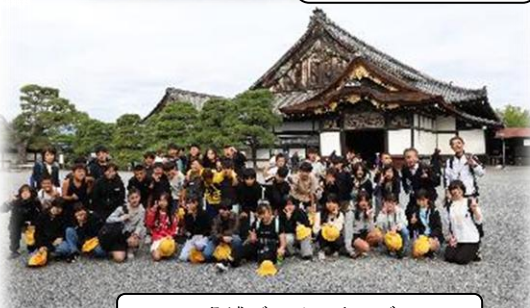
二条城でハイ、チーズ。