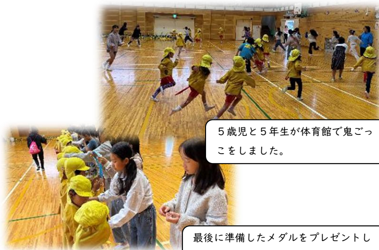
5歳児と5年生が体育館で鬼ごっこをしました。