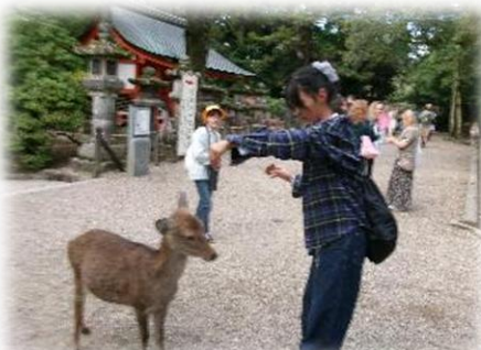
奈良公園の鹿はお辞儀をします。