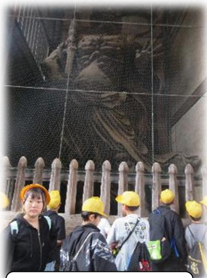
教科書で見た南大門の仁王像。本物の迫力に圧巻です。

2日目は、二条城、金閣寺、龍安寺の石庭といった名所を巡りました。子どもたちは、その建築美や工夫に「すごい!」と感嘆の声を上げ、古の人々の知恵に深く感心していました。締めくくりは太秦映画村で時代劇の雰囲気満喫。古代から近世まで、1300年分の日本の歴史を体感する、最高の学びの旅となりました。