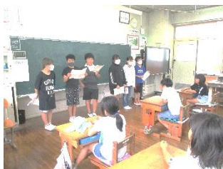
【自然学校の発表の様子】

今年は、コロナ前の活動に戻すことができ、野外料理づくり、カッターカヌー体験、磯観察など多くの体験活動ができました。