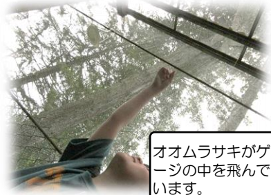
オオムラサキがゲージの中を飛んでいます。

とができました。オオムラサキのお話を聞かせていただいた3年生を中心に世話も一生懸命に取り組んでいました。「先生!蝶になったよ。」「先生大変や。蝶が網にはさまってる!」と日々いろいろな歓声が聞こえてきました。