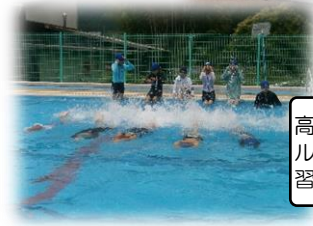
高学年ではクロールなどの泳法を学習します。