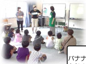
バナナの歌を楽しく学習しました。

6月29日(木)に2年生が市内の栄養教諭6名による食育の授業をしていただきました。「おなかを元気にするひみつを知ろう」をテーマに食物繊維が多く含まれる食べ物を知り、元気に1日を活動するためには朝からバナ