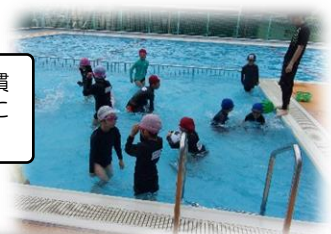
低学年では水に慣れることを大切に学習します。