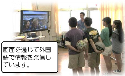
画面を通じて外国語で情報を発信しています。

6月のプール開きから、どの学年でも10時間ほど水泳の学習を行っています。梅雨の中、晴天に恵まれる日は少ないですが、子ども達は毎朝、職員室に来ては「プール入れる?」とやってきます。水泳の授業