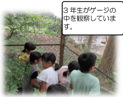
3年生がゲージの中を観察しています。

今年も校山園のゲージの中にオオムラサキの幼虫を入れていただき、無事にサナギから蝶に羽化するこ