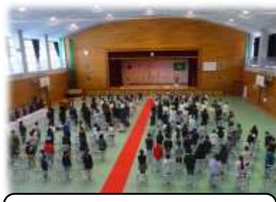
入学式が4/10(月)に晴天の下、挙行されました。