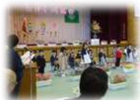
名前を呼ばれて元気に返事しました。

児童数193名、家庭数137戸、教職員数24名で、本年度の和田小学校が、スタートしました。