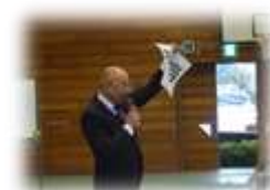
挨拶の言葉の由来を話しました。