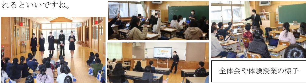
全体会や体験授業の様子

入学説明会時に予定していた青垣小6年生に向けた体験授業を2月17日に実施しました。国語、英語、技術の3教科の中から希望を取り、タブレットを活用しながら中学校の先生による授業を体験しました。いつもと違う環境のため、初めは緊張している様子も見受けられましたが、慣れてくると意見を言ったり、質問をしたりして楽しそうに授業を受けていました。4月入学以降、少しでも早く青垣中学校に慣れるといいですね。