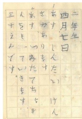
こくごノート (2年生4月7日)