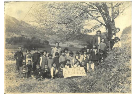
「1ねん2くみのよいこ」 (昭和29年4月19日)

入学した時の写真は、川土手の桜の木の前で写しました。この場所は、現在プールになっています。