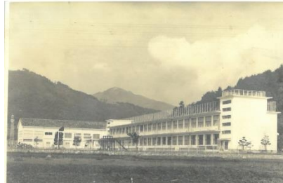
前山小学校新校舎全景 (昭和34年7月8日)

冬の暖房は、ダルマストーブでした。当番の時は、山へ行き、焚き付けの柴を作り、自分達で火をつけました。