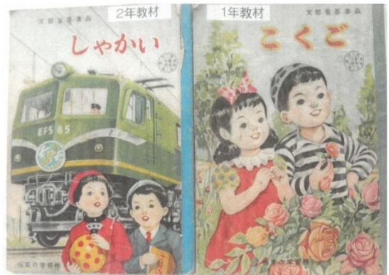
2年「しゃかい」教材 1年「こくご」教材