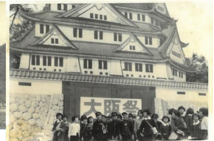
5年生社会見学「大阪城」

給食は、6年生の2学期からパンと粉乳が始まりました。粉乳が嫌い、飲むことが嫌でした。