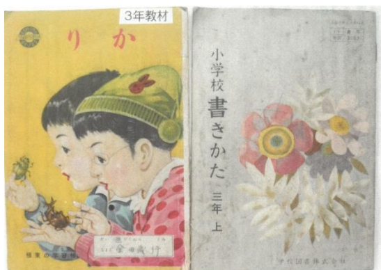
3年「りか」教材 3年「書きかた」教科書