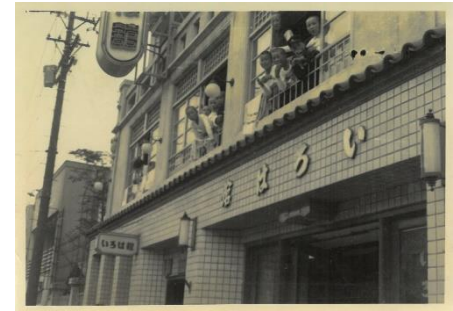
6年生修学旅行「いろは旅館」

6年生の学芸会で、戦争に出征する時の状況を披露しました。出征の歌に合わせて、日の丸の旗を振りました。(いってくるぞといさましく ちかってくるにをでたからにゃ・・・)