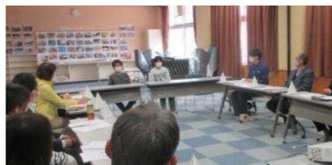
「もっとあいさつを！」

3月9日（木）に6年生の代表2名にも参加してもらい開催しました。6年生の素直な思いを聞かせてもらい、新たに気づかされたこともありました。それらをもとに協議を行い、来年度の学校経営方針が承認されました。