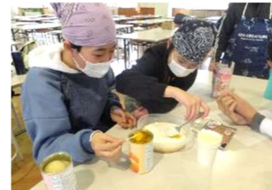
「一日パラダイス」お菓子作り

6年生が卒業を前に「絆～Happy～感謝・思い出・楽しむ・つなぐ」をテーマに自分たちで計画準備して行う「卒業プロジェクト」を実施しています。6年生を送る会で在校生に渡した手紙や「伝統のバトン」もプロジェクトの一つです。その他にも、感謝の気持ちを表す愛校作業で清掃活動を行ったり、お世話になった方々への手紙を作成したり、タイムカプセル、卒業文集の作成、お別れ遠足などなど、様々なプロジェクトを実施しました。自分たちでアイデアを出し、計画し、実施していく姿に「自律×創造×つながり力」の成長が感じられました。培った力を中学校でも発揮して活躍してくれることを期待しています。