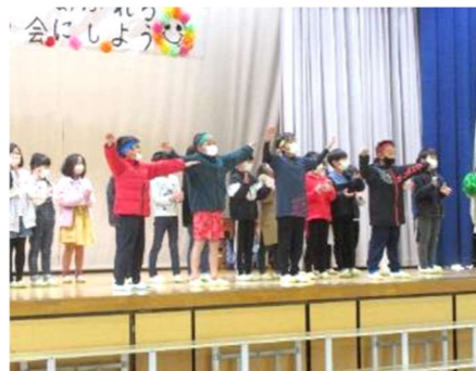
2年生 6年生応援団！ 6年生への思いの大きさを大きな声で。