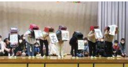
5年生 ランドセルをつかってお礼のメッセージ「中学校でも頑張っ！」