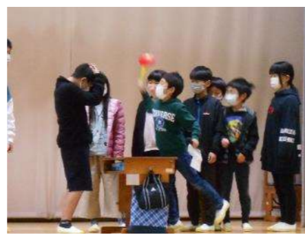
3年生 6年生といろいろ対決！ 6年生、さすがのお返しでした。