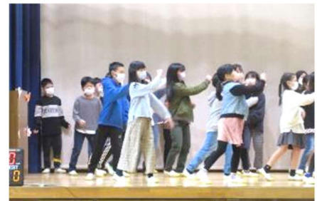
4年生 キレキレのダンスでメッセージを送りました。