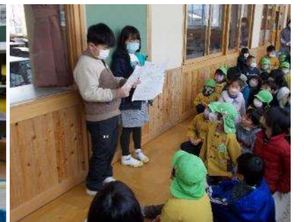
机はなんこあるでしょう!?