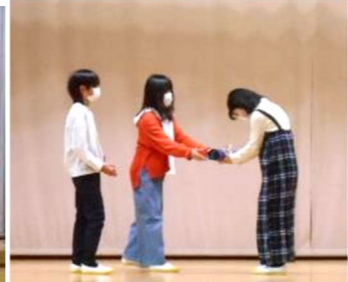
6年生から「伝統のバトン」を受け取りました。