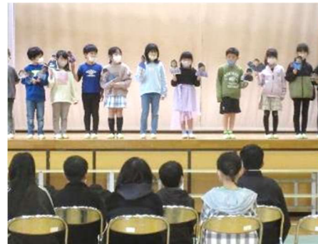
1年生 学級閉鎖の2組の友だちの分も感謝の思いを伝えました。