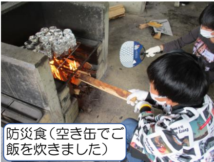
防災食（空き缶でご飯を炊きました）

今年度は日帰り3日と1泊2日の5日間の実施となりました。兵庫の豊かな自然を感じながら学校ではできない体験を通して仲間との絆を深めることができました。天気にも恵まれ、思い出に残るよい体験となりました。