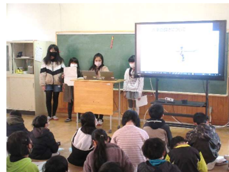
高学年ではプレゼンテーションで資料を作成するグループも