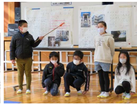
3年生 役割分担しながら発表