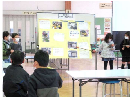
2年生 タブレットも使いながら