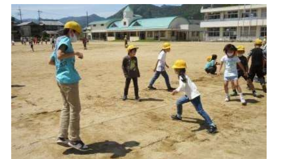
高学年が見本になって