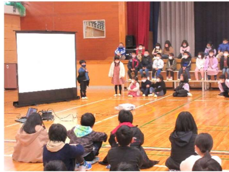
1年生 初めての発表