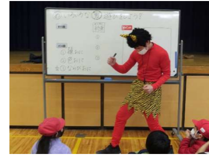
2年生 鬼と「鬼ごっこ」

2月3日(水)と4日(木)に普段担当してもらっていない先生に授業をしてもらう「スペシャル授業」を行いました。これは、子どもたちをより多くの教師が多面的に見て、児童理解を深めることを目的としています。子どもたちも普段とは先生と学習するので、いつもより集中しているように感じられました。