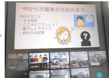
オンラインでクイズ

一人1台のタブレットパソコンが導入されておおよそ1年たちます。子どもたちは日々の学習だけでなく、様々な活動で活用しています。2月9日には児童会がタブレットを使ってオンライン児童集会を行いました。三密にならないよう全校が集まる集会活動を行うことが制限される中、子どもたちはタブレットという新たな機器をうまく活用しながら、学校生活を楽しく過ごせるよう工夫しています。