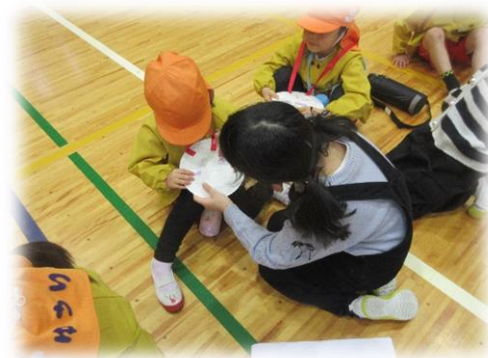
1年生1学期カリキュラムの例