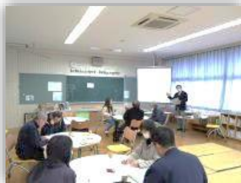
運営協議会の様子 西小学校図書室にて

今年度最後の学校運営協議会がありました。活動の振り返りや、アンケートについての意見交換をし、学校評価、学校経営方針について協議した後、地域づくり支援チーム、学び支援チーム、安心・安全支援チームに分かれて、今年度のまとめと、来年度の活動について話し合いをしました。来年度も活動を続け、アンケートから、「地域と連携した活動をする為にはどのような活動ができると思いますか」の多くの回答から、「森山に登る」「星空を観察する」に重点をおいて新たな活動もしたいとの意見もありました。