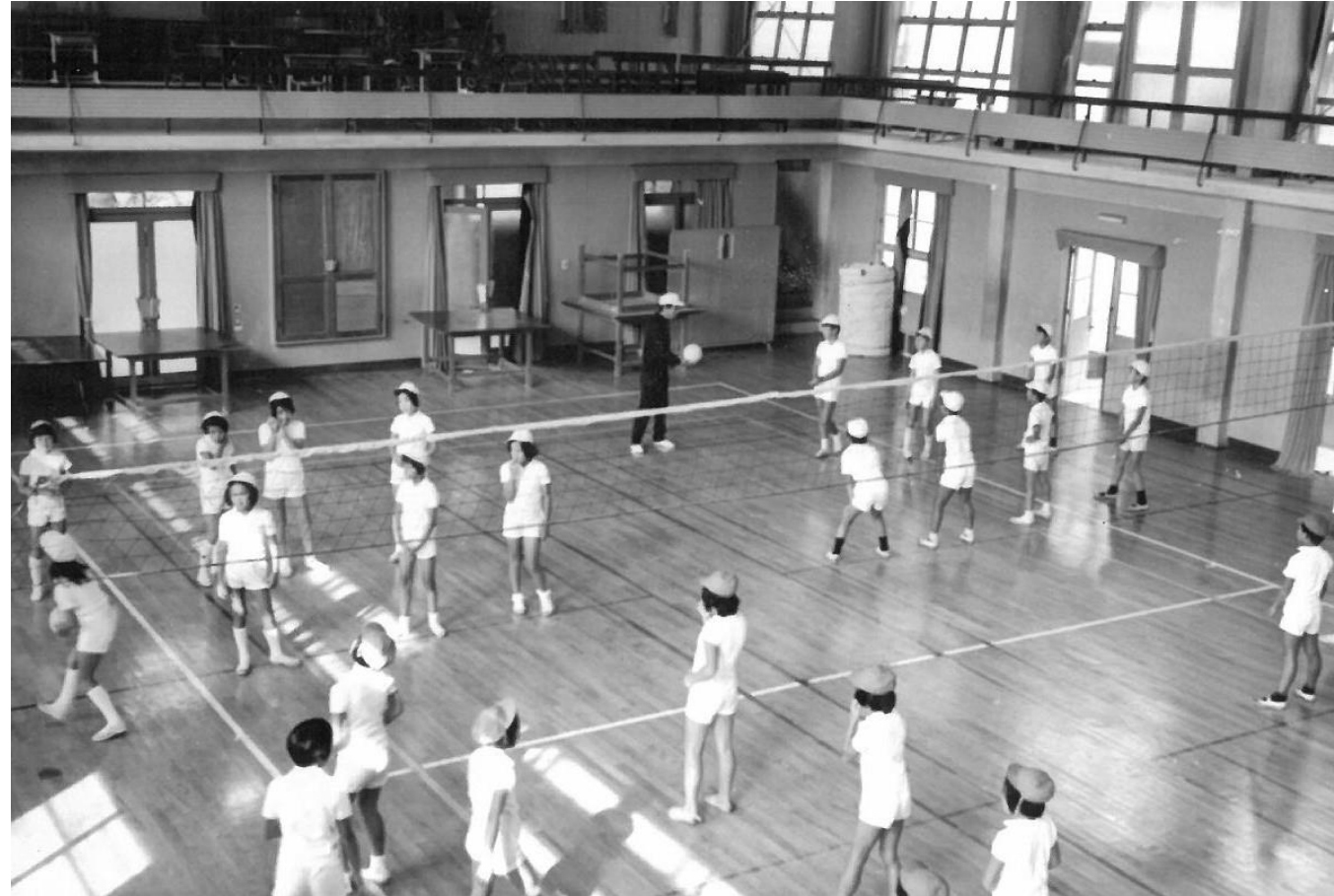
旧校舎 体育授業風景① 年度不明