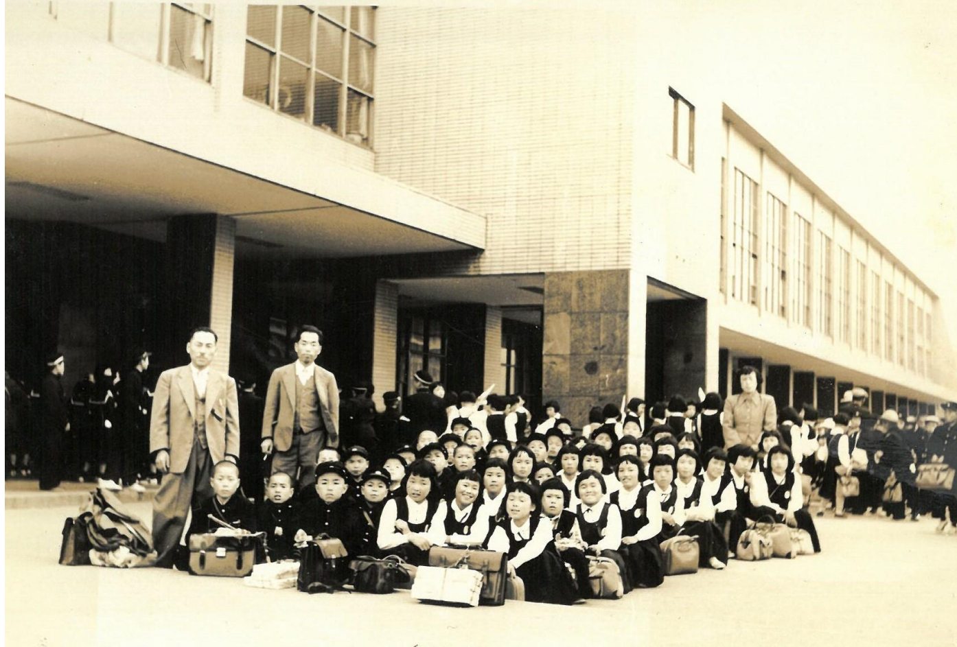
昭和31年 修学旅行（京都駅にて）