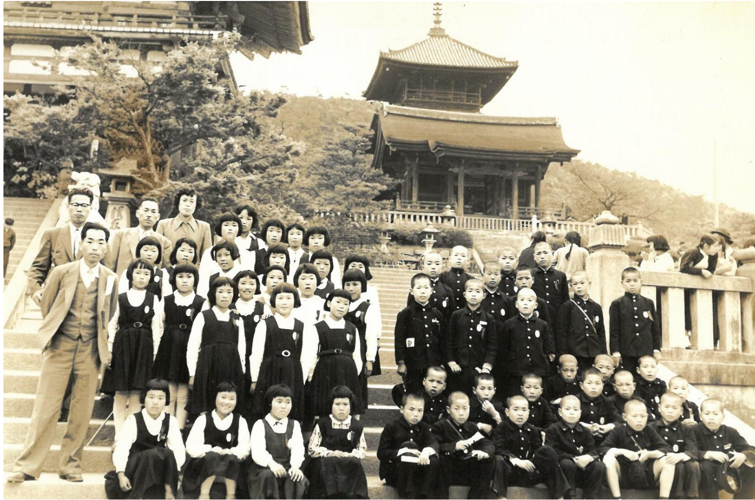
昭和31年 修学旅行（京都 清水寺にて）