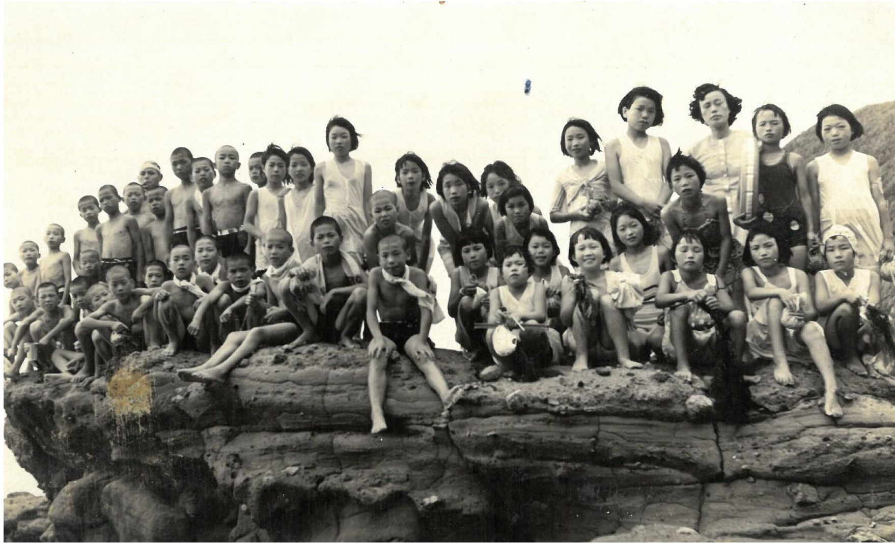
昭和31年 臨海学校 (竹野浜)