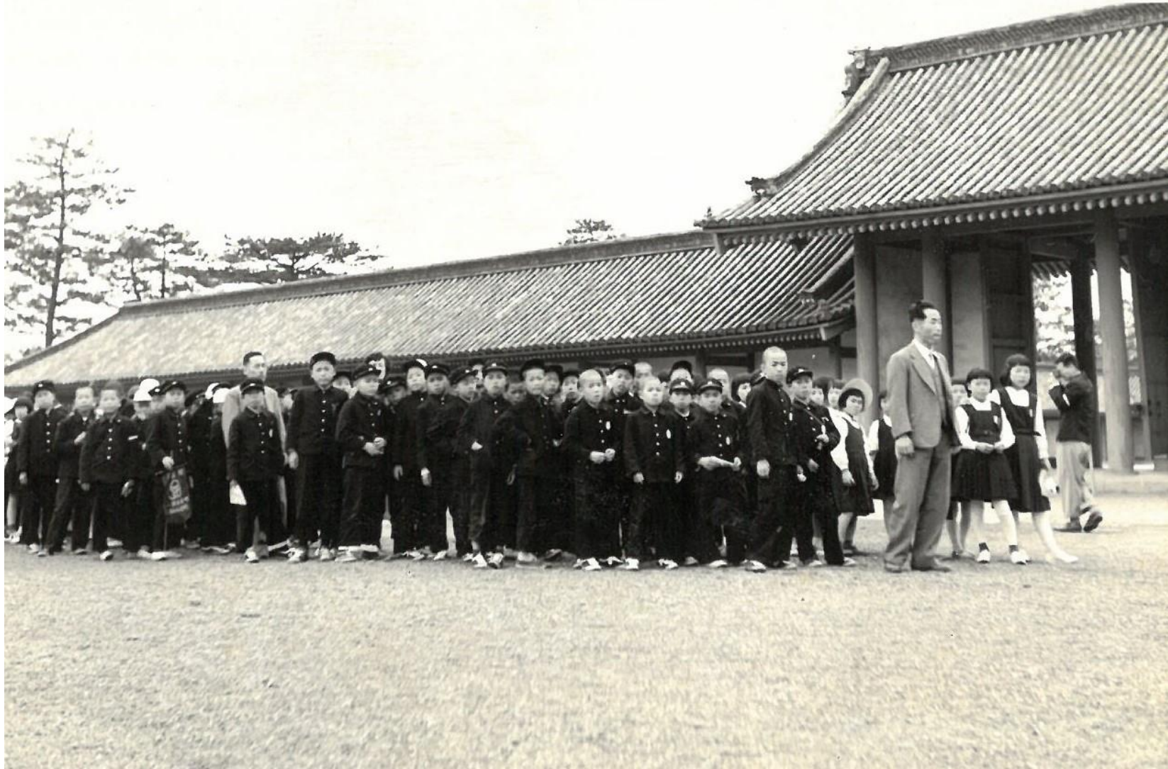
昭和31年 修学旅行（京都御所にて）