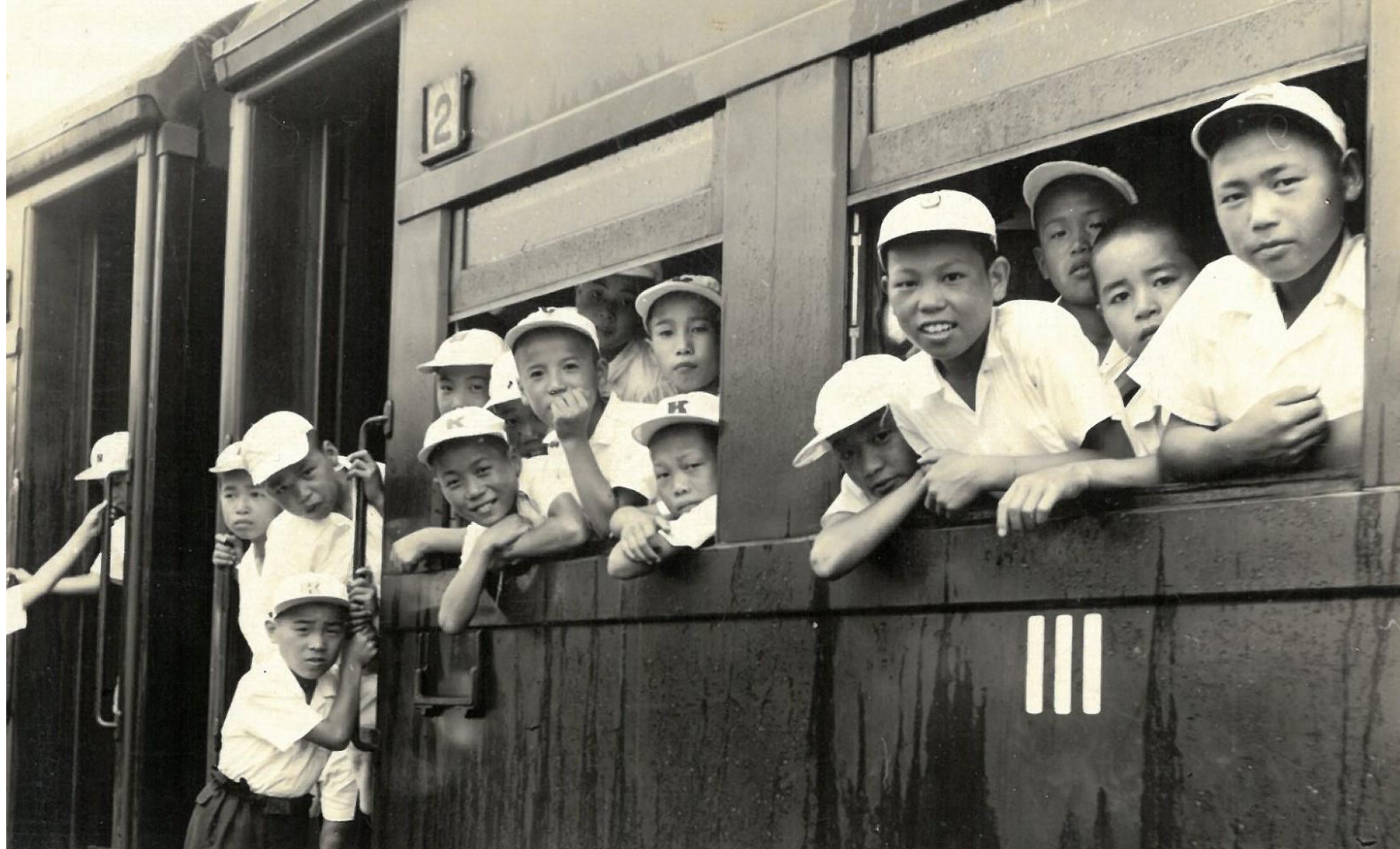
昭和31年 臨海学校 (竹野へ向かう汽車にて)