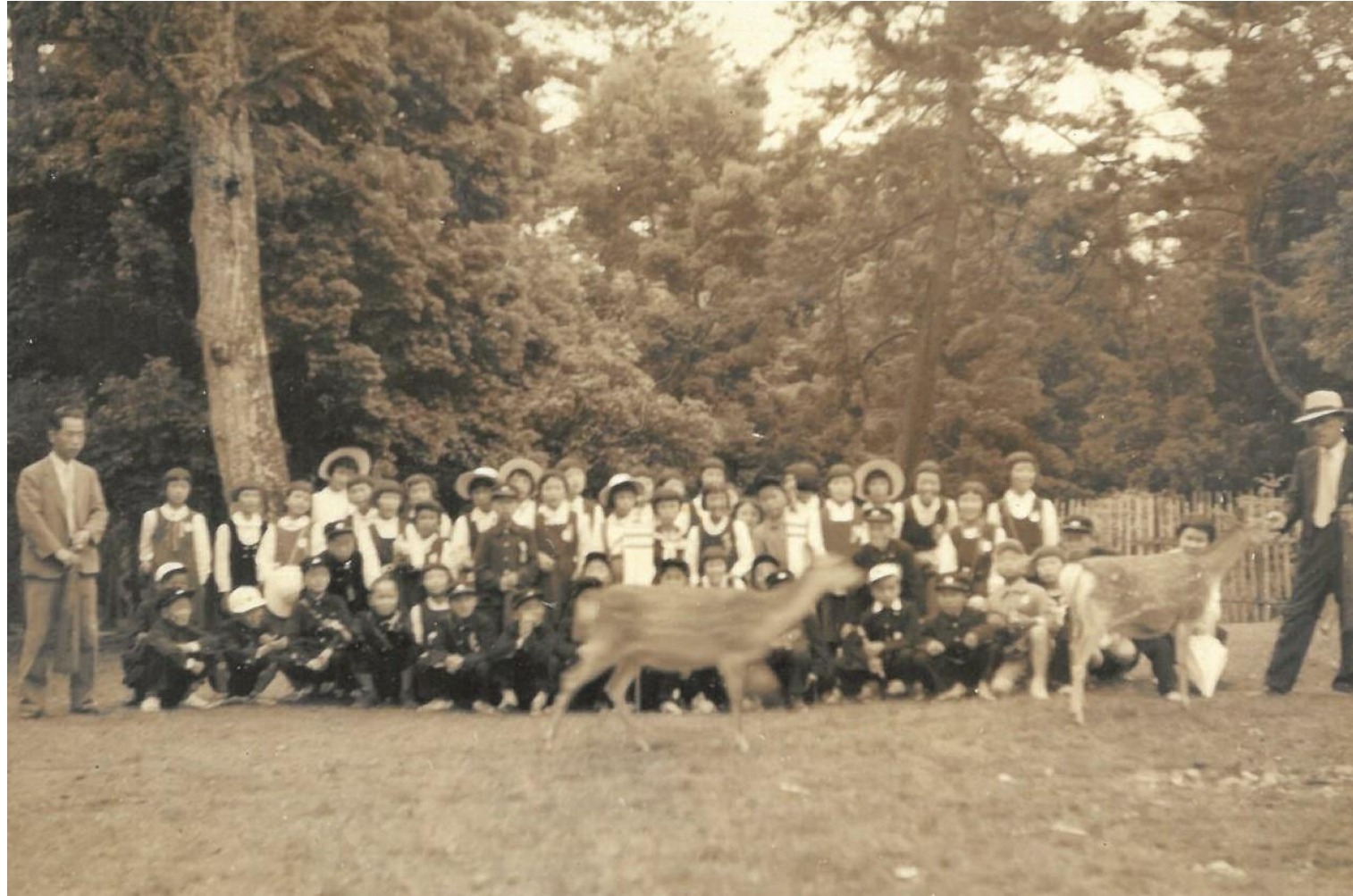
昭和30年 修学旅行 奈良公園