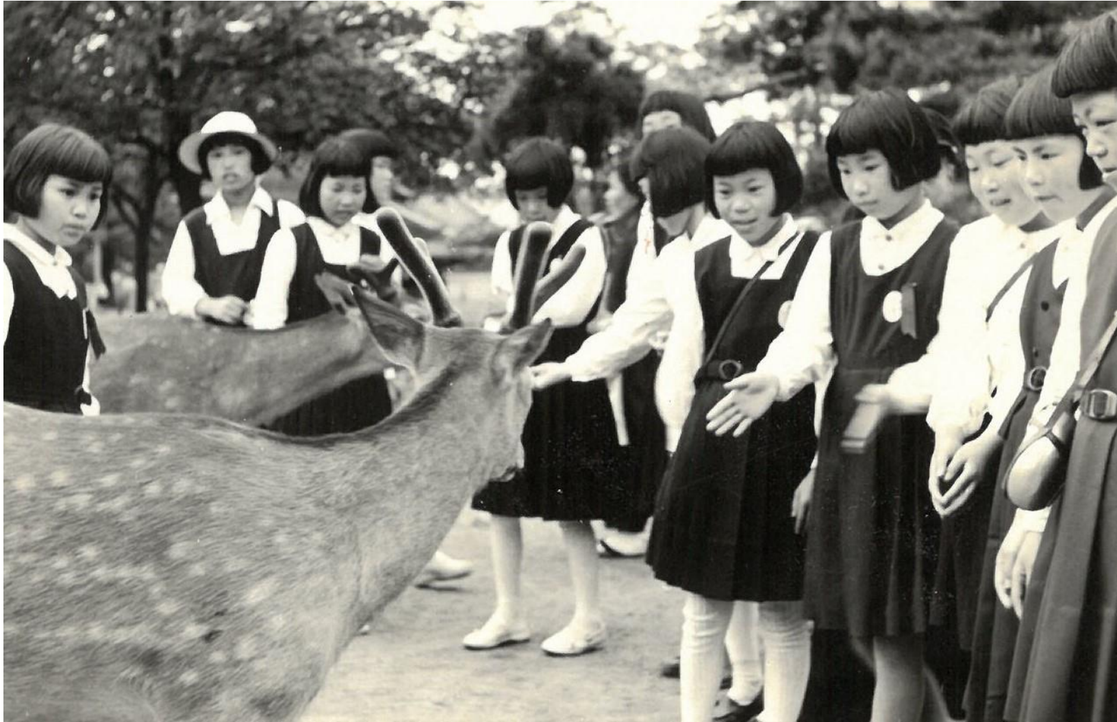
昭和31年 修学旅行（奈良公園にて）