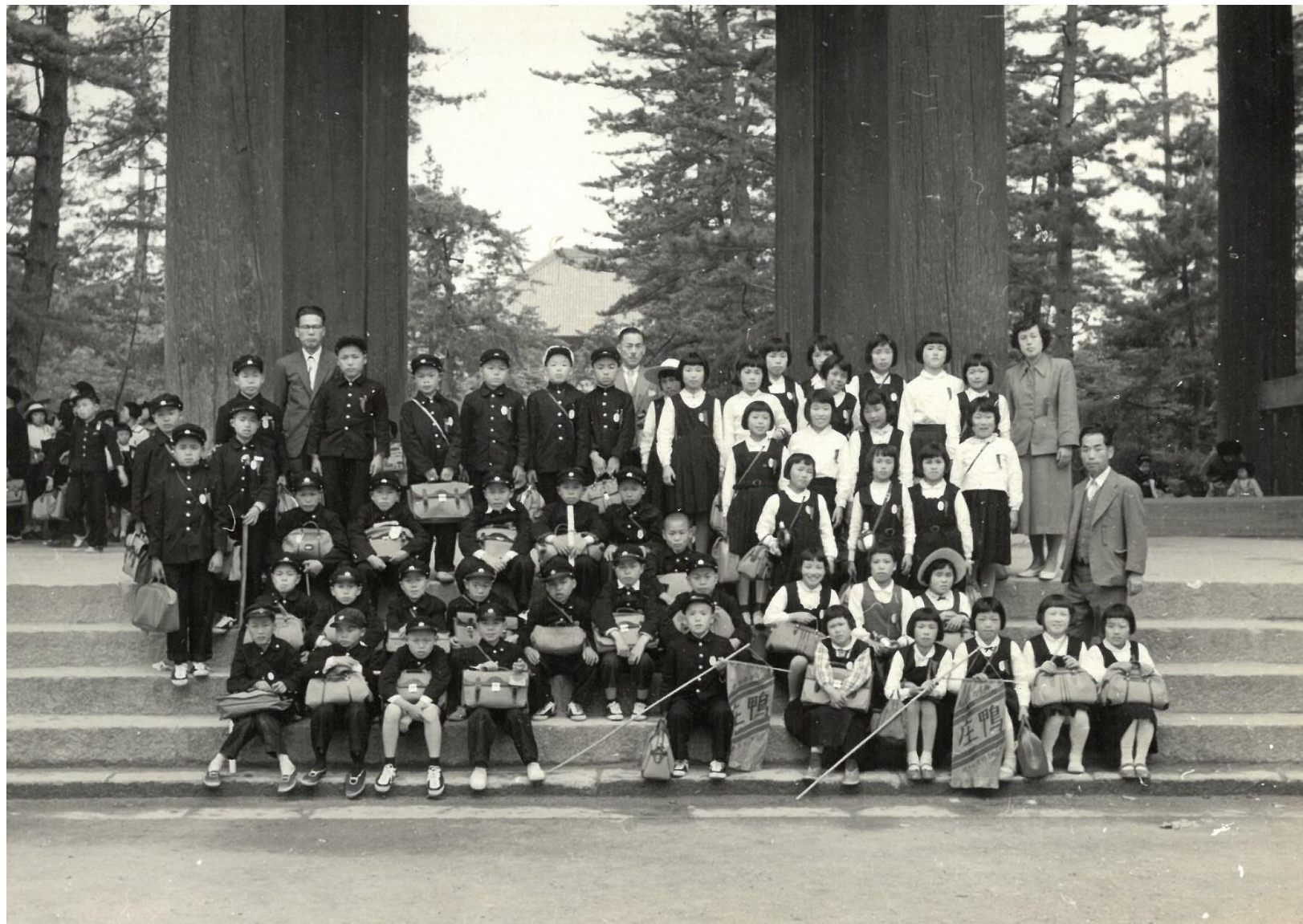
昭和31年 修学旅行（奈良 東大寺 南大門にて）

しゅうがくりょこう なら「とうだいじ」のもんで しゃしんをとりました。(70ねんまえ)