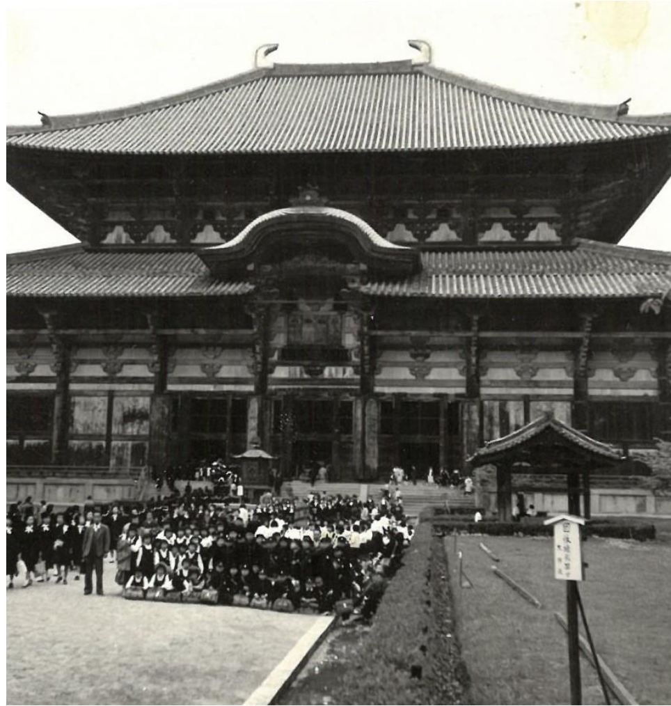
昭和31年 修学旅行 (奈良 大仏殿)