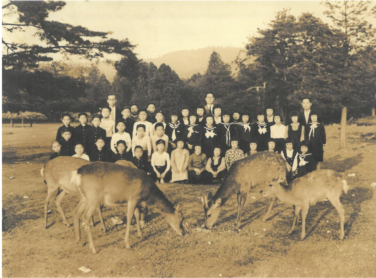
昭和29年 修学旅行 奈良公園