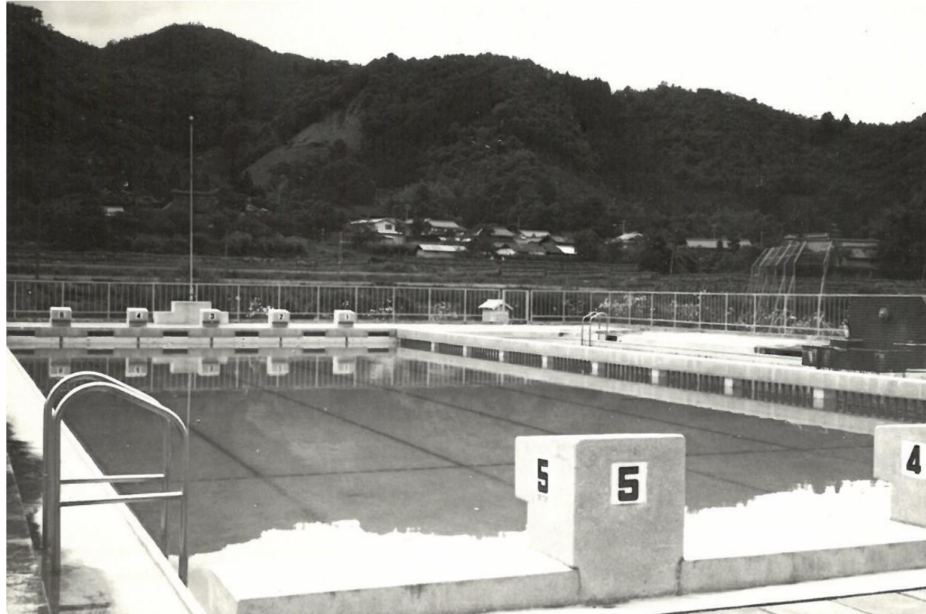
旧校舎 体育授業風景② 年度不明