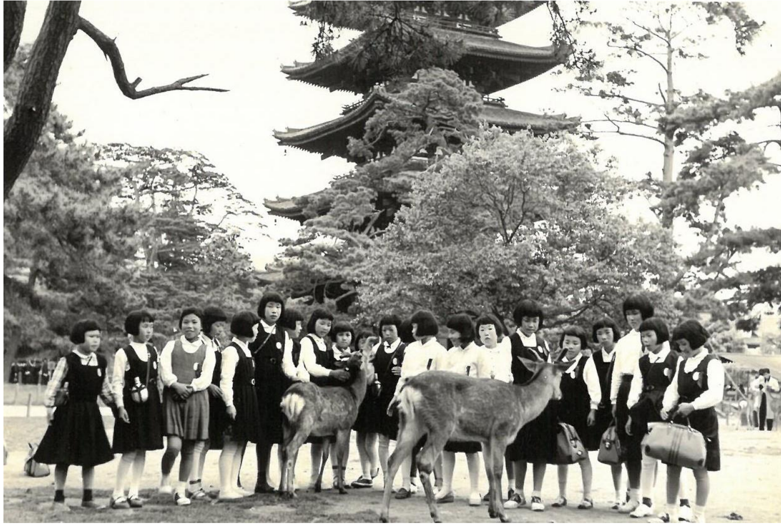
昭和31年 修学旅行（奈良公園にて）