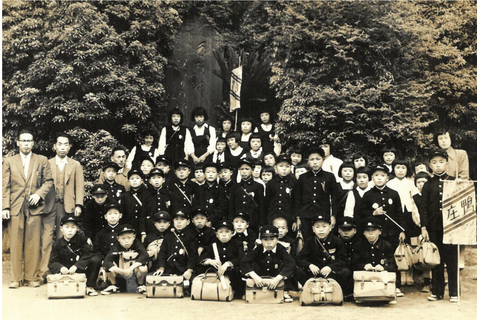
昭和31年 修学旅行 (奈良二月堂にて)