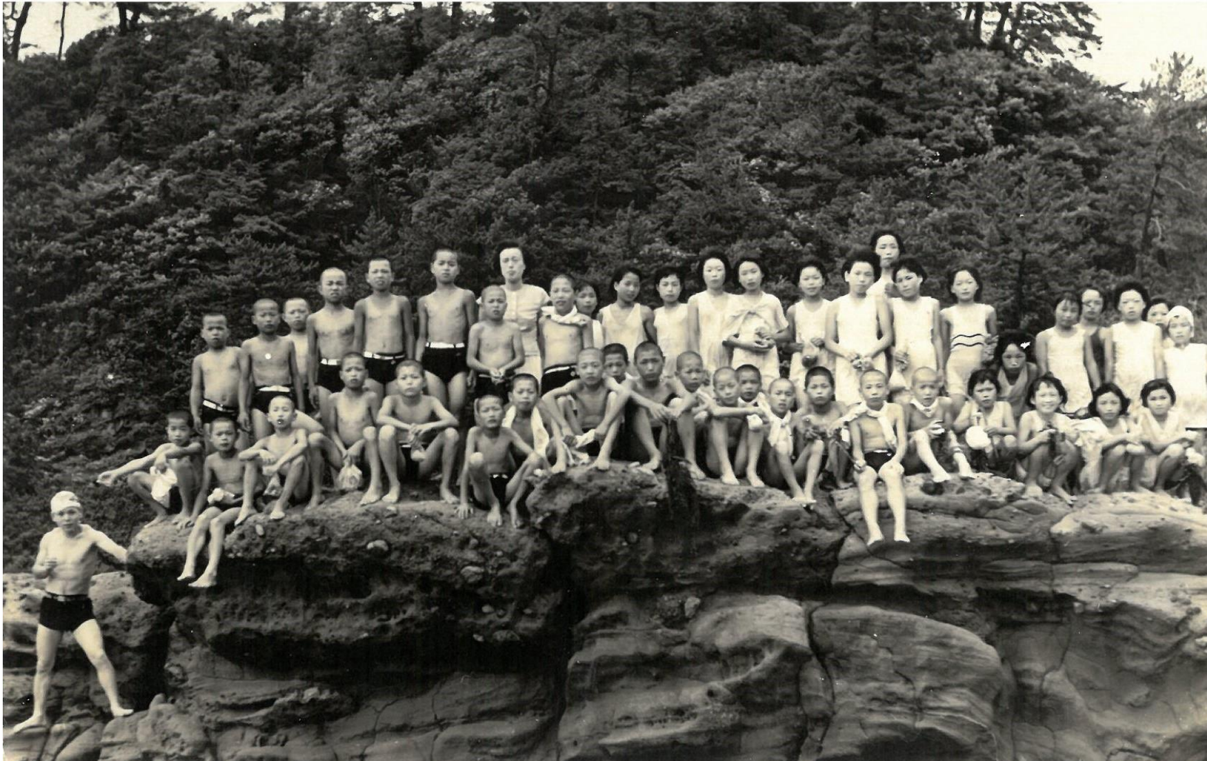
昭和31年 臨海学校 (竹野浜)