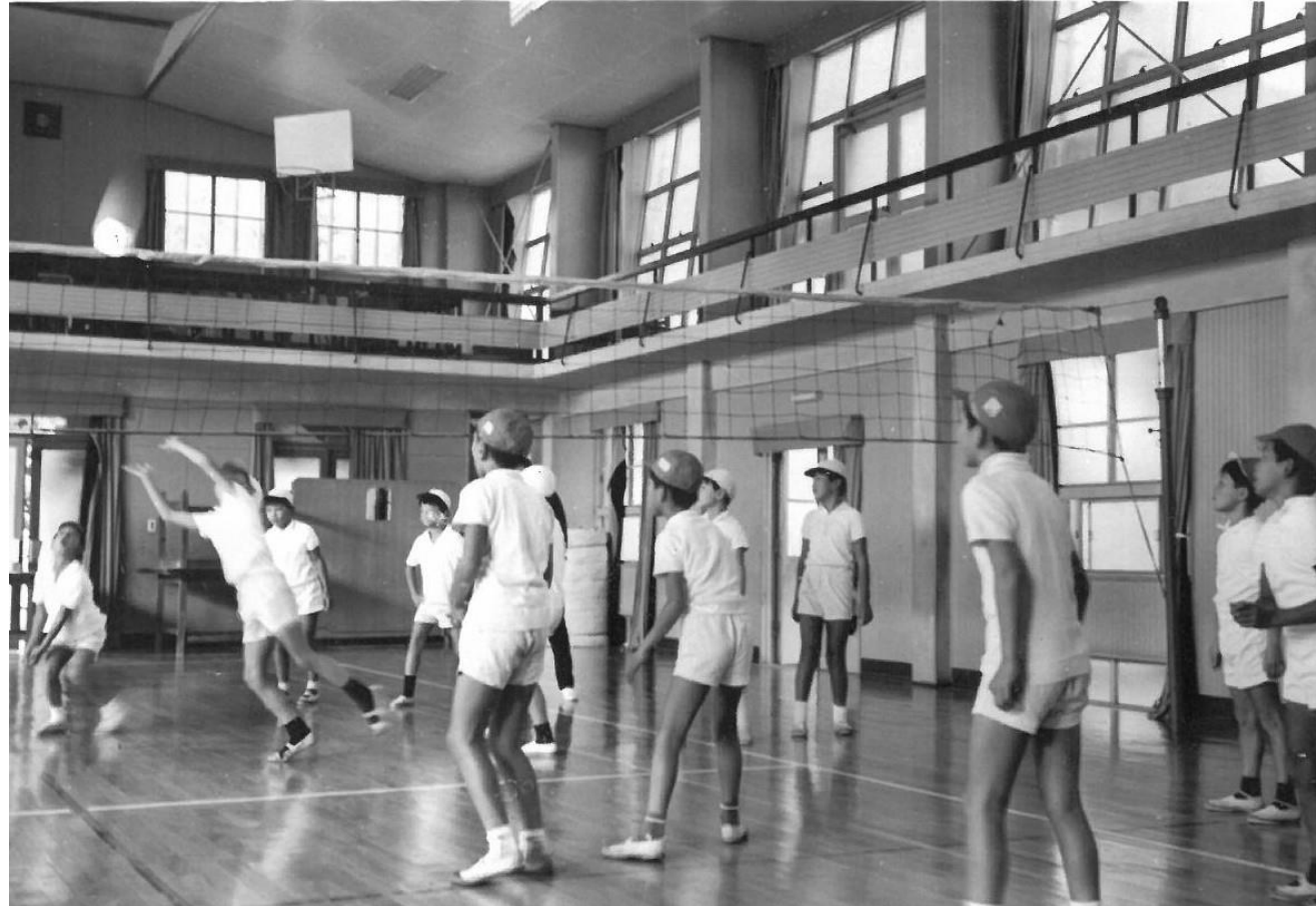
旧校舎 体育授業風景② 年度不明