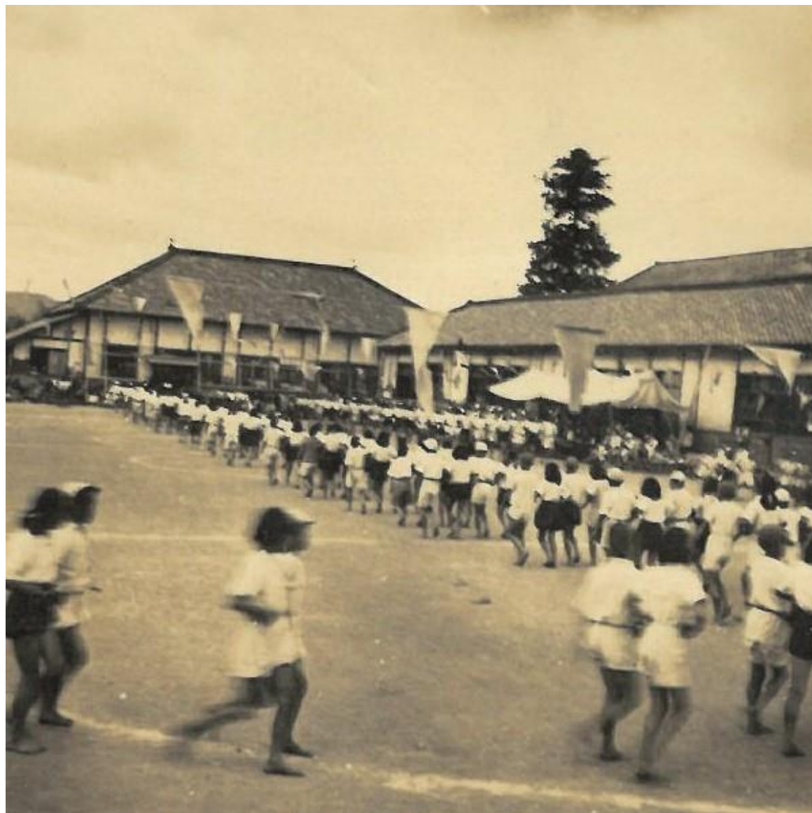
昭和20年 運動会の練習 風景①