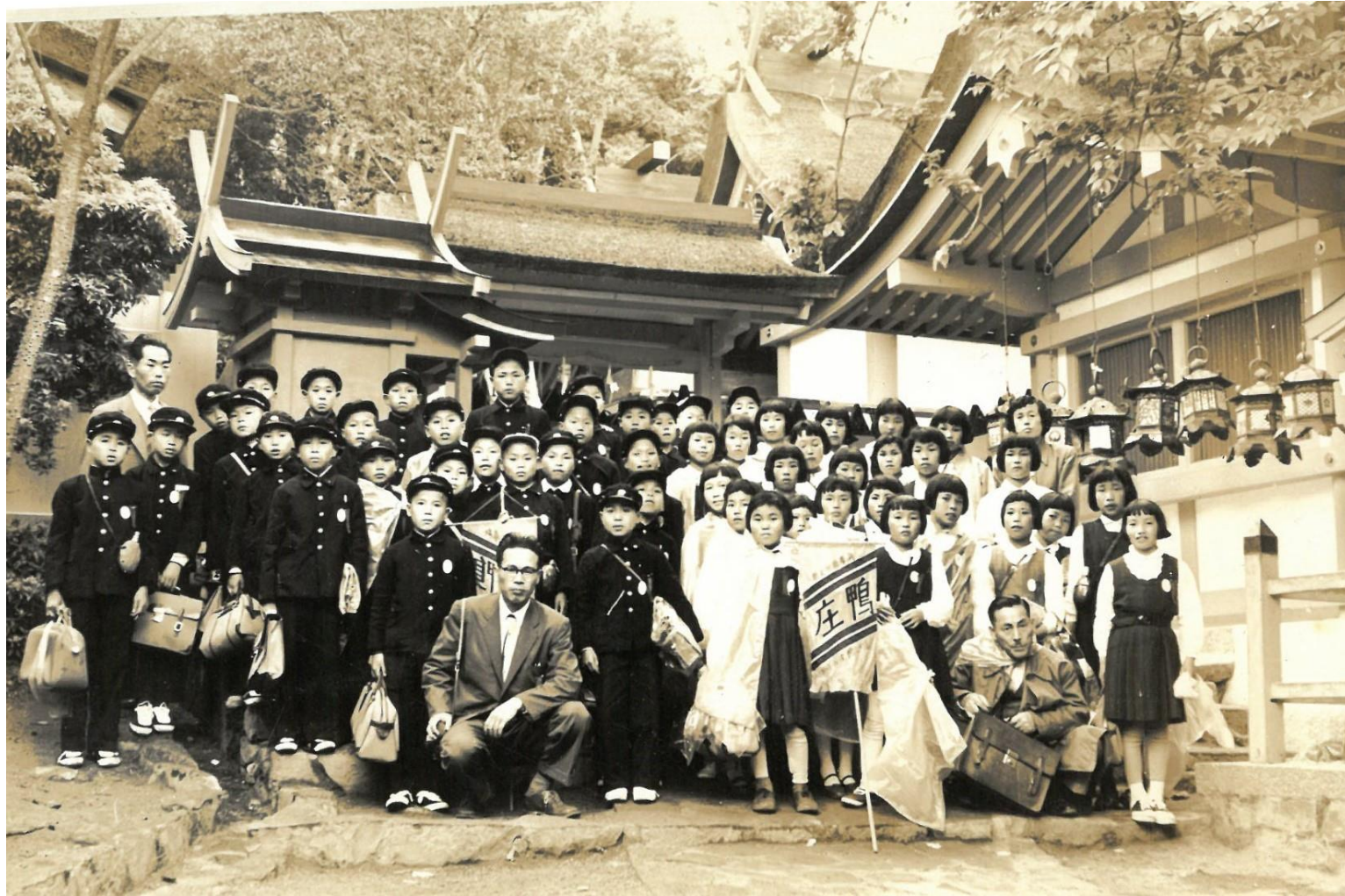
昭和31年 修学旅行 (奈良 春日大社にて)