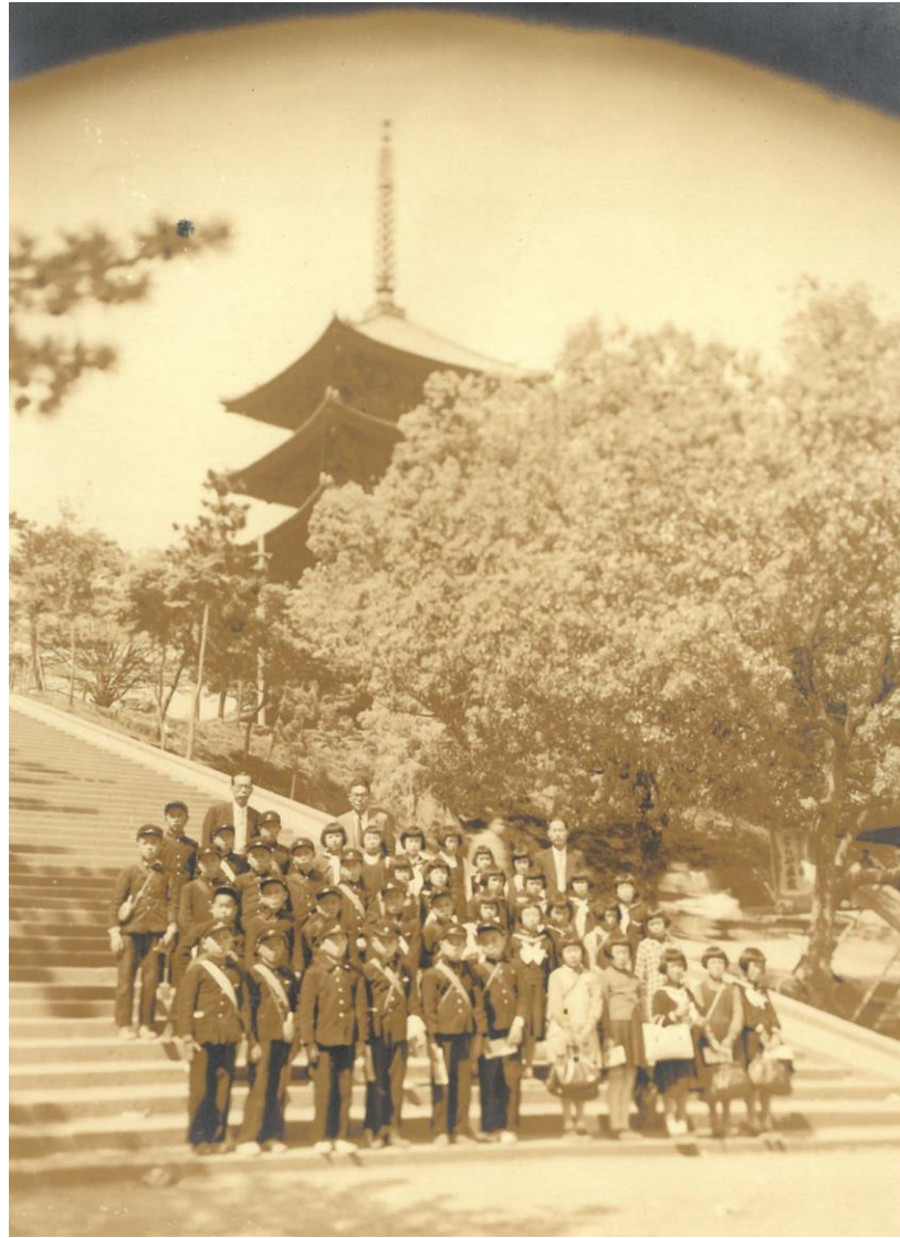
昭和29年 修学旅行 奈良公園②