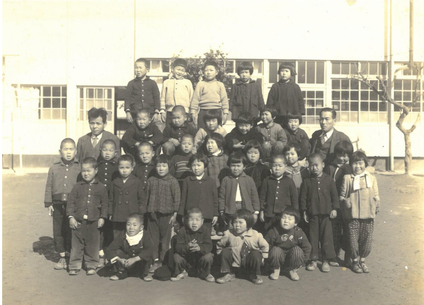
昭和31年 2年生 集合写真 (校舎前にて)

2ねんせいが こうしゃのまえで がっきゅう しゃしんを とっています。(70ねんまえ)