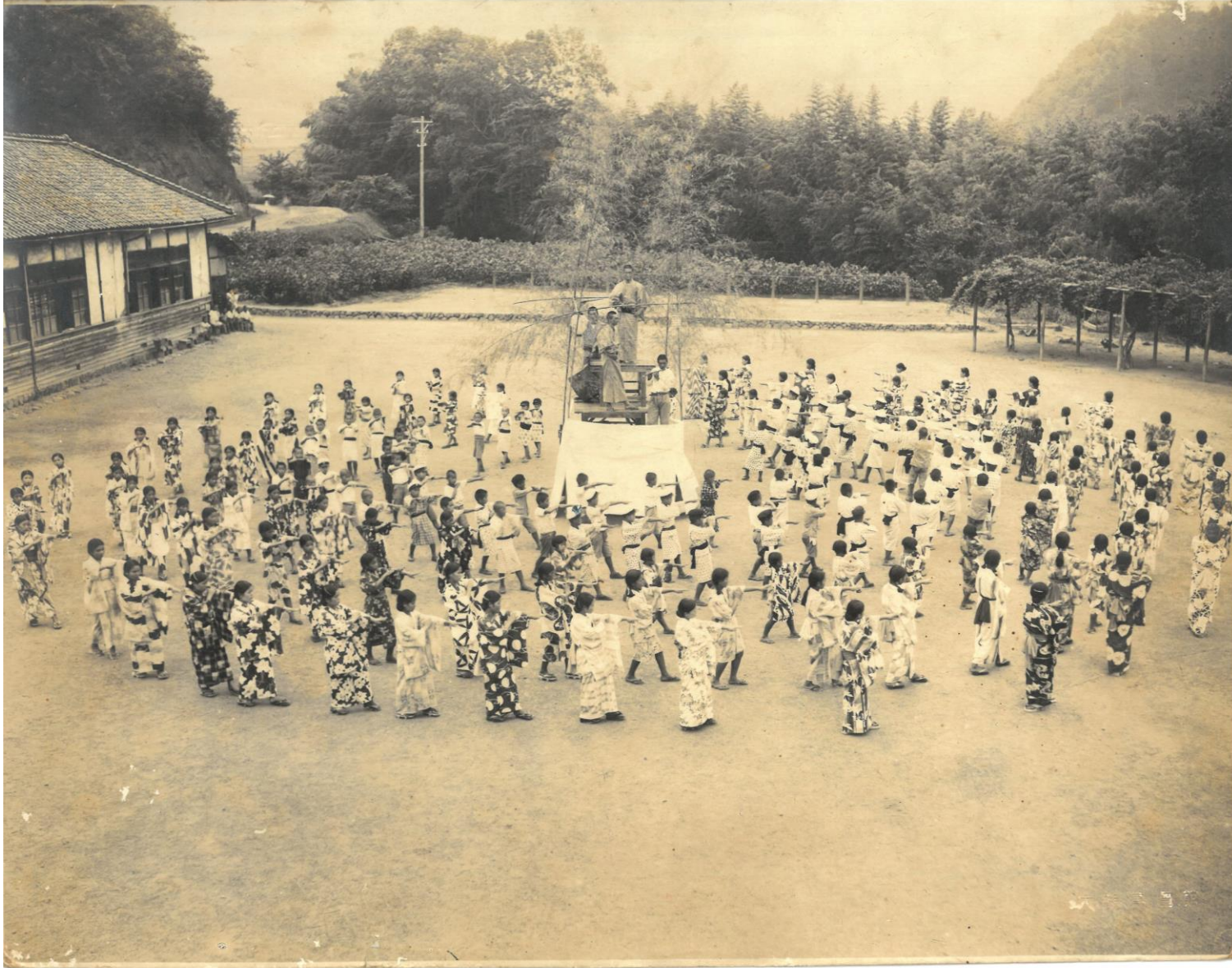
昭和13年 運動場で盆踊り大会