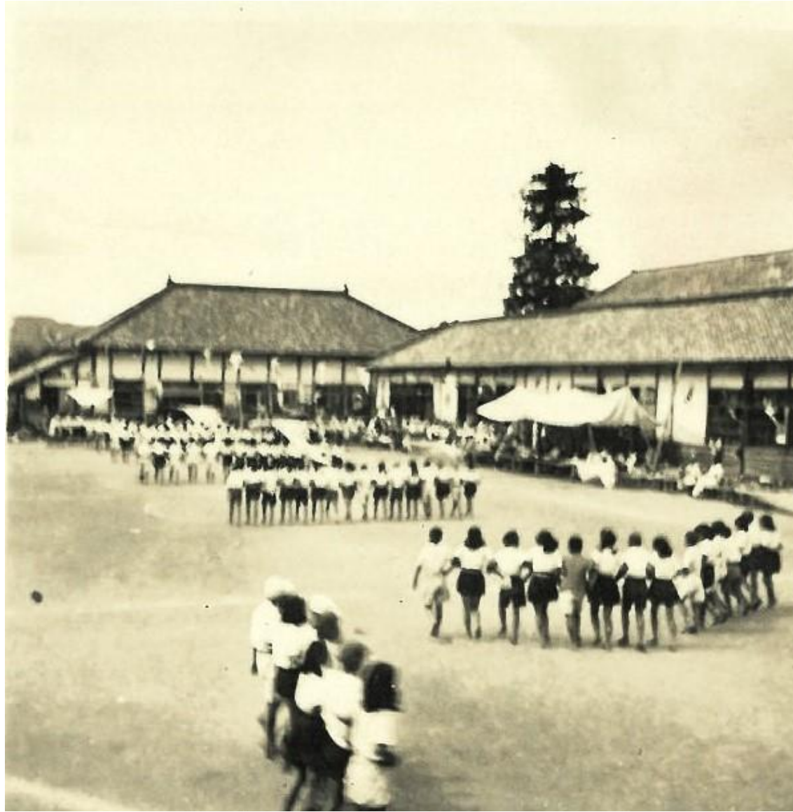
昭和20年 運動会の練習 風景②