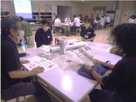
ワークショップ形式で行われた熟議の様子