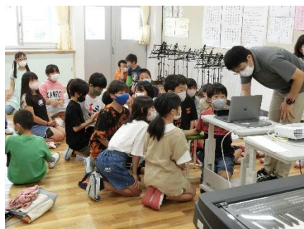
オーストラリアと接続します