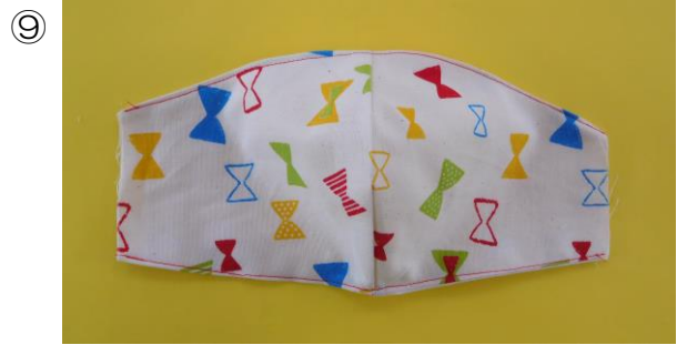
マスクの上と下の端をミシンで縫う。 (端ミシン)