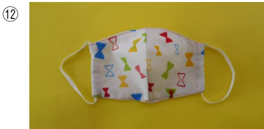
ゴムをいれて、端を玉結びする。 結び目を中にいれる。