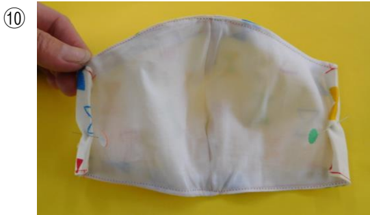
左右の端を三つ折りにして、アイロンをかける。