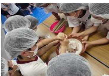
魚のすり身をつくります