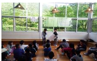
朝の集いも自分たちで