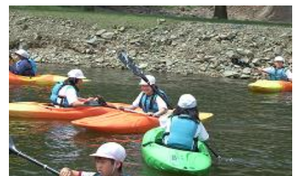
まっすぐすすむかな？