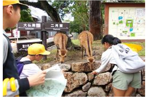
エサもたくさんやしました