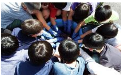
染液につけています

5年生は、5月14日～18日まで、4泊5日の自然学校に行ってきました。「あ」あいさつ、「お」おもいやり、「が」がまん、「き」きょうりよくをめあてに、52名がたくさんの体験活動にチャレンジしてきました。